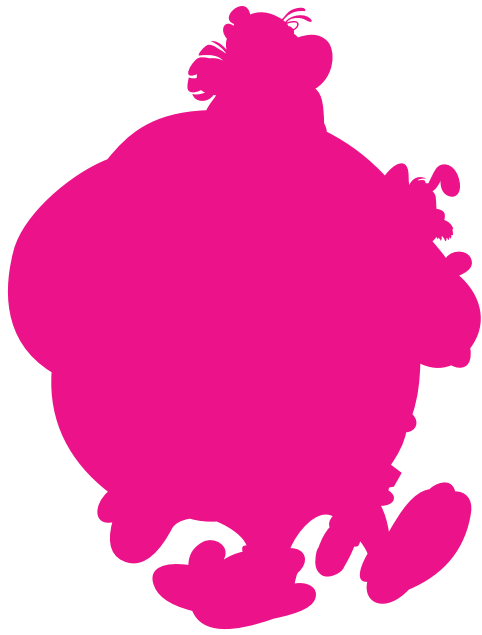
Wit print aangegeven in 100% magenta in aparte laag "Wit"